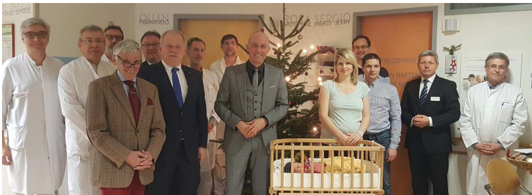
Friedberger Allgemeine vom 24.12.2016: